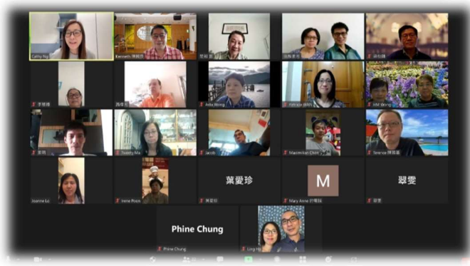
與宣道會茵怡堂弟兄姊妹相聚分享