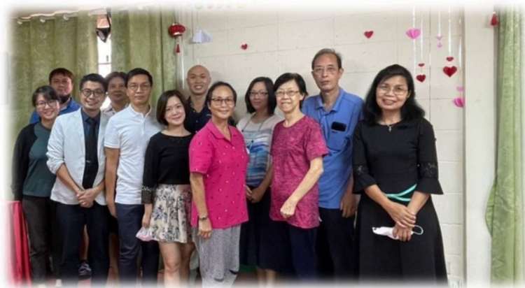
歡送一對夫婦移民到英國