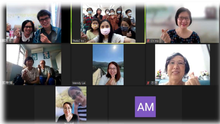
宣道會屯門堂週一差傳祈禱會分享及兒童崇拜帶領聚會