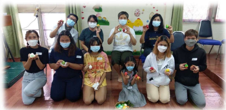
同工們舉辦復活節慶祝活動