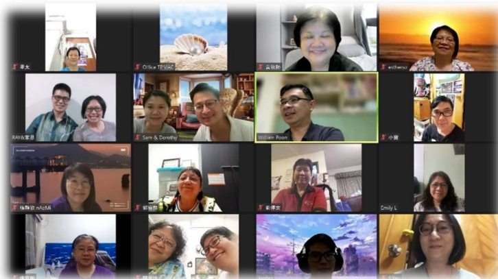
得到母會(宣道會大埔宣)眾肢體的祈禱及加力