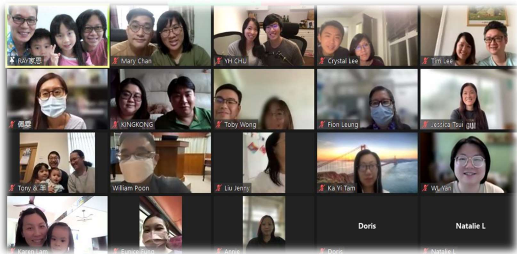
享受與我們熟悉的團契分享 (來自 4 地：英、加、泰、港)

5 年的日子中發生的事情實在太多，過去香港社會面對疫情及社運動盪，我們相熟的朋友大都移民，未能與他們好好相聚及送別，香港教會多番的人事變動等，有種無形的慨嘆，加上早前家恩爸爸的身體，激發我們更想回港探望家人，好好與他們見見面及大吃大玩一餐，關心他們.....這種感受讓我們想起昔日宣教士幾年後回鄉所面對的感受：變遷的社會景象與步伐、又熟悉又陌生的面孔、支持者的減少等，那種複雜的情緒是宣教士需要調節及面對的，幸好現在資訊科技發達，雖不能實體相見，也可隨時方便聯絡，期待明年暑假能順利回港吧！雖然未能回港，幸好今次的「另類述職」，可以讓我們夫婦二人各自到酒店退修 5 日，稍作休息安靜，重整自己身心靈、被神的說話醫治、調整及計劃將來事奉方向。事實上，在工場的事奉實在太忙碌，加上人手支援太少，停下來卻無人頂替，有時連放假都感到奢侈，難怪宣教士是一個容易令人 Burn out 的工作，感謝神在我們「述職」期間，有其他宣教同工暫時頂替我們日常堂會的工作，以致我們能專心好好的述職。