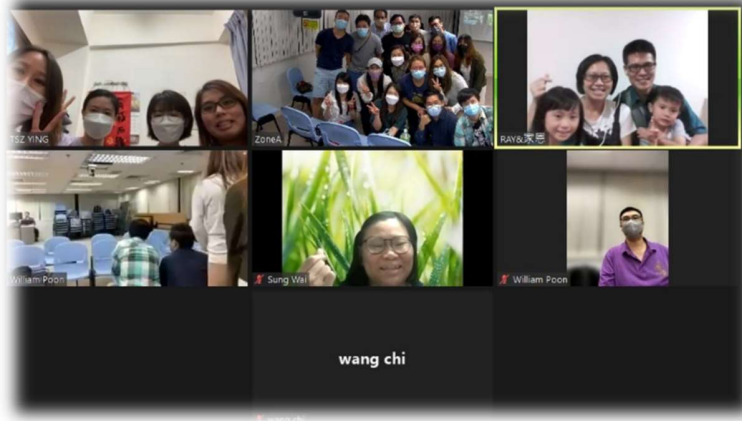
鼓勵昔日曾牧養的年青人