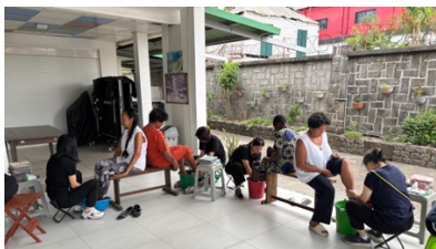
短宣隊員與鄒省弟兄姊妹彼此洗腳

在今年年初，香港宣道差會為我們工場籌組聯堂短宣隊，讓不同堂會的弟兄姊妹均有機會來短宣，而時間剛剛就是能夠支援風災後的救援工作，再一次看見神無形的手在預備他們。他們一行 11 人、來自 6 間不同的堂會，雖然籌備時間不太長，但他們為馬島鄒省工場帶來很多嘗試及祝福。首先，他們預備了鄒省教會受苦節默想聚會，讓鄒省教會弟兄姊妹首次以彼此洗腳的方式去記念耶穌基督的受苦和謙卑，另外，亦舉行了大學生生涯規劃工作坊。短宣隊又與兩所本地學校合作，舉行公開考試班講座、復活節嘉年華及老師家長災後心靈健康講座，此外，又到訪兩所本地教會參與援助扶貧工作，包括派發現金飯券、環保舊衣物及飯盒。其實，最讓我們感動的，是他們在工場仍未恢復供電的時候與宣教士一家共同經歷「無電生活」：每天要摸黑沖凍水涼；天氣炎熱但沒有風扇（有隊員甚至要睡地板散熱）。這一隊明知山有「苦」、偏向「苦」山行的短宣隊，為我們帶來莫大的鼓勵，他們的付出，正正是學效耶穌基督，與基督一同受苦，成就祂福音的工作，這是我們最難忘的一個預苦期和受難節。