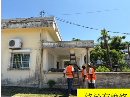
終於有維修人員來到了！

風災過後，我們的孩子常常問：「幾時有返電？」，經過 64 天的「無電生活」，水電局終於派維修人員來我們的住處接駁電纜，他們來到的一刻，我們有一種「苦盡甘來」的感受，經過很多日常生活上的困難，以及家庭成員曾輪流生病，生活終於開始復常。回望這 64 天的生活，我們感受到更多神的創造奇功：無風扇下，讓我們更享受自然風；無燈的晚上，讓我們更體會趁著白日，要多作主工；無電的社區，更顯出星星的光亮。