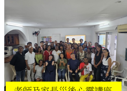
老師及家長災後心靈講座