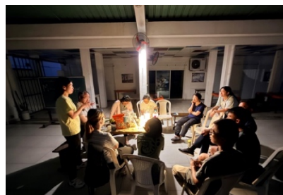
太陽下山後以電筒照明及分享