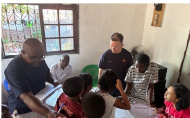
到本地教會派發愛心飯券