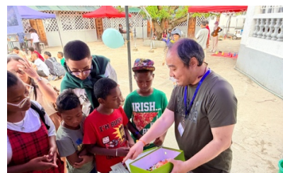
到學校舉行攤位- 講解五色福音