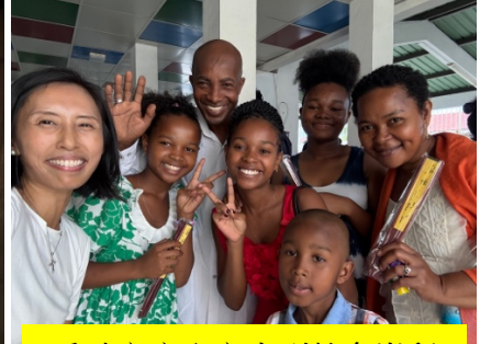
受助家庭全家來到教會崇拜