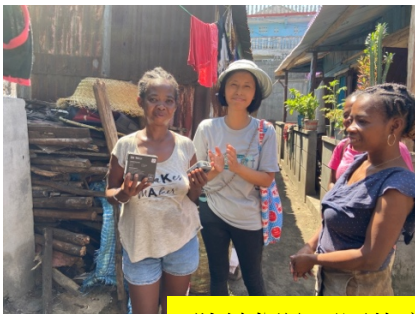
陸續探訪不同的家庭及發放資助、物資

此外，風災經歷又讓我們在宣教服侍中多了機會接觸不同群體及階層，包括與本地學校、本地教會結連及合作，又透過資助房屋重建計劃，探訪有需要重建的家庭，透過這些服侍，我們有機會與他們分享福音，當中有一些受援助的家庭都來到教會參與崇拜。