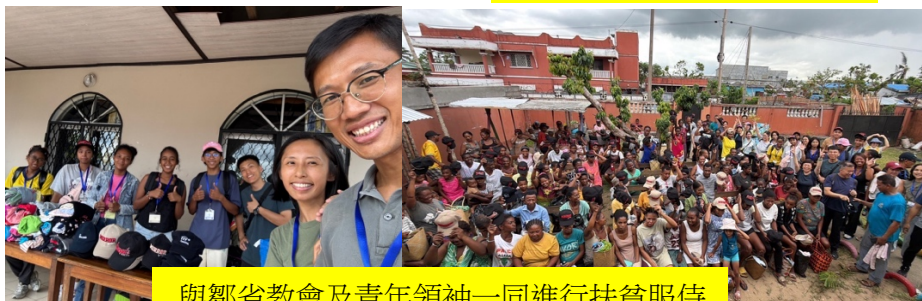
與鄒省教會及青年領袖一同進行扶貧服侍