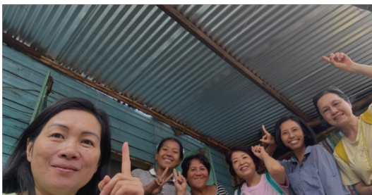
探訪受資助重建家庭 - 新屋頂已重建