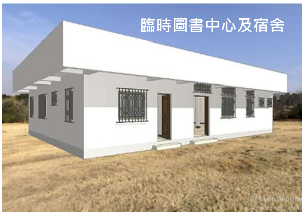
臨時圖書中心及宿舍