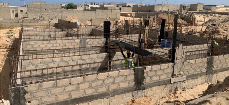
臨時圖書中心的平房地基也建好了