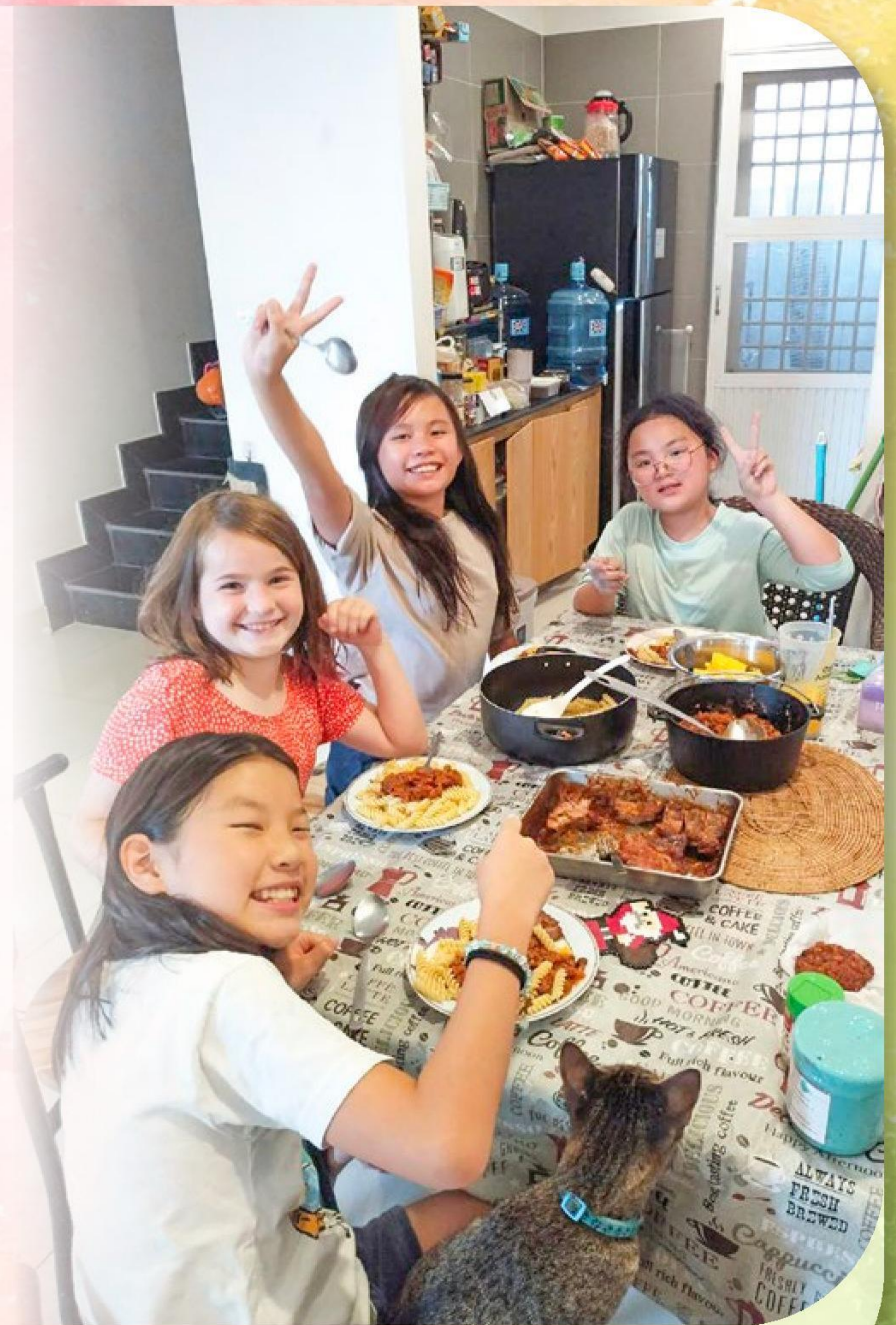
希言（右2）邀同學來家玩