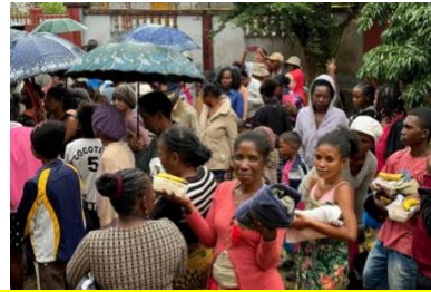
當地人得到衣物及飯盒後的笑容

短宣活動後，我們收到一位參與大學生英語活動的學生信息，他告知我們他的家被火燒了，其後我們有機會探訪他，知道他家居起火原因，原來是因為一些街上的小孩玩火所致，而他的家是由竹及木建成，一切化為烏有。我們問及他的需要，他表示暫時有地方居住，但需要一些煮食用具，我們就把一些廚具送了給他應急。這年青人的經歷讓我們感受到 馬島 生活的不安定，我們有邀請他繼續回到教會，願神繼續安慰他的心。