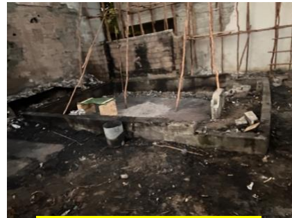
到訪被火燒後的家園