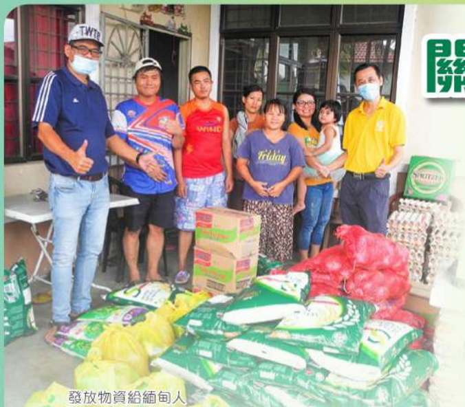
發放物資給緬甸人

疫情期間，緬甸人主日崇拜完全停止，無法聚會和進行奉獻。因此，緬甸同工一家也面對經濟困難，