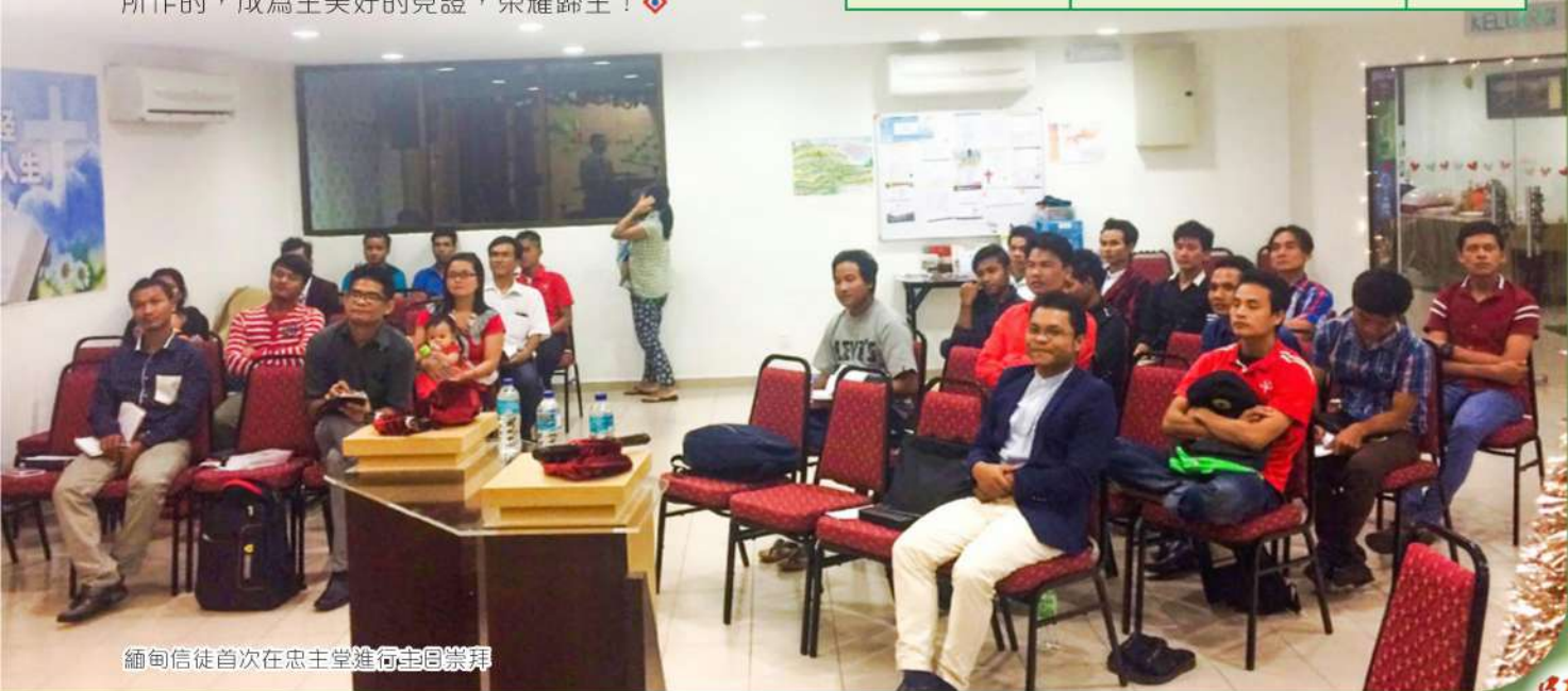
緬甸信徒首次在忠主堂進行主日崇拜