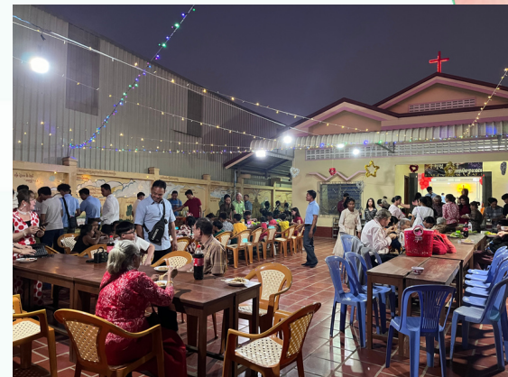
▲ 宣道會福音教會除夕聚餐

一月頭，人力資源學院開展新的學年，本屆收了約二十位新生，當中也有不少已經信主，是很有活力的年青人。求主賜智慧給老師和同學，願教學相長，一同經歷主的豐盛。