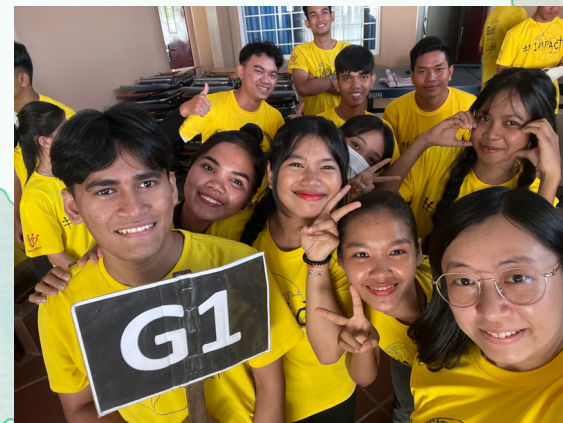
▲ 人力資源學院新學年迎新週