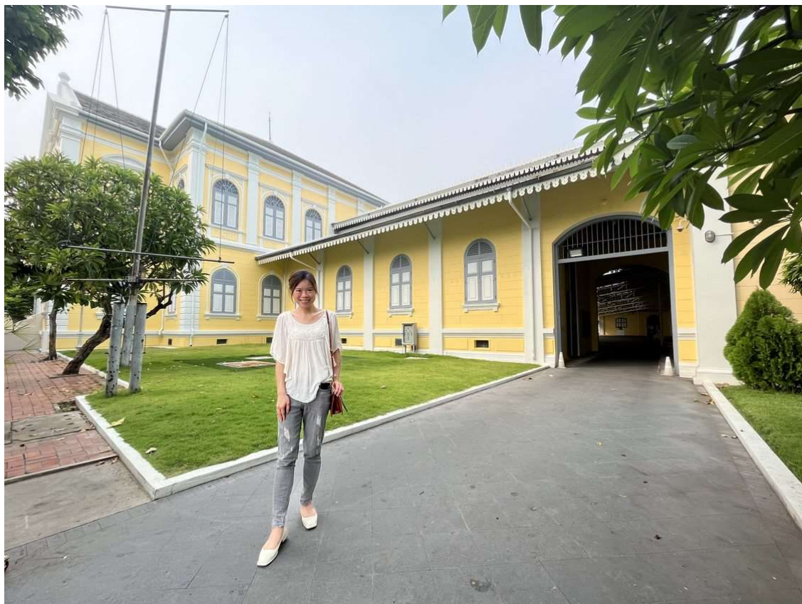
於國立美術館門前留影

凡投靠你的，願他們喜樂，時常歡呼，因為你庇護他們；又願那愛你名的人都靠你歡欣。（詩5:11）