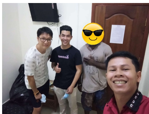
與來自美國的朋友找到新旅館