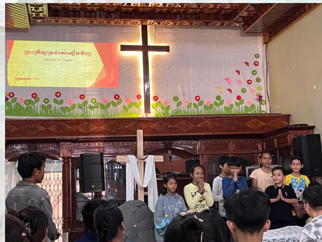
▲ 復活節崇拜兒童獻唱