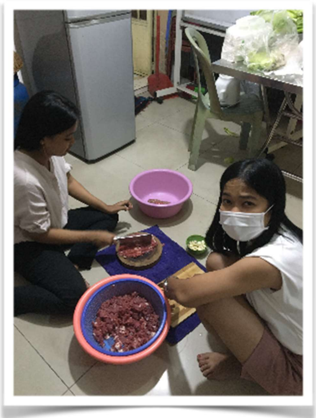
自製牛肉漢堡包，讓弟兄姊妹們在復活節當天可以吃到又美味又便宜的漢堡包！