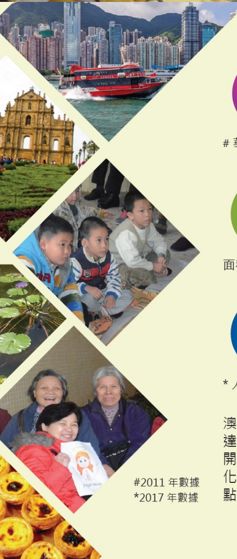
#2011 年數據 *2017 年數據