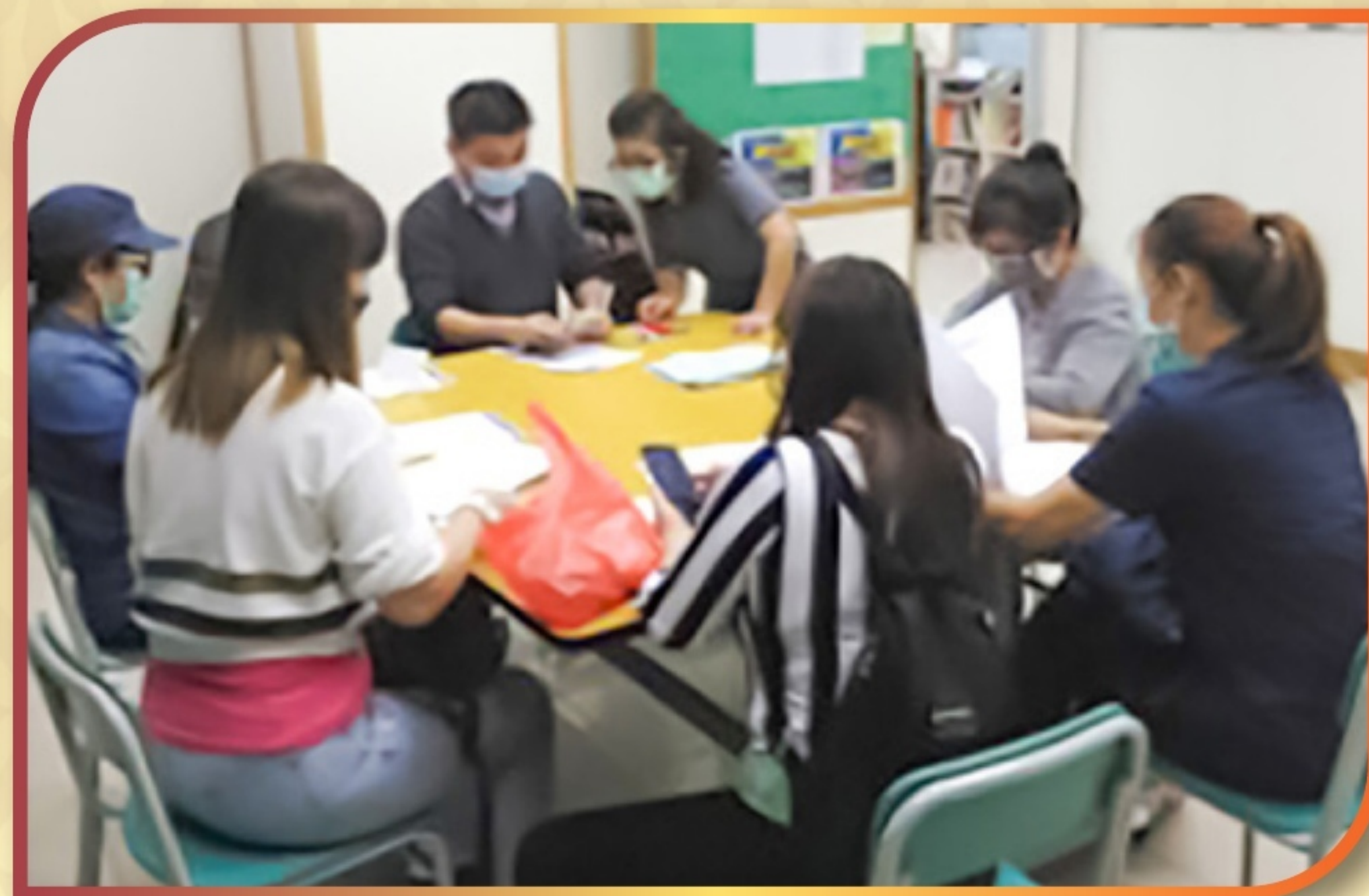
協助本港泰國人申請政府津貼