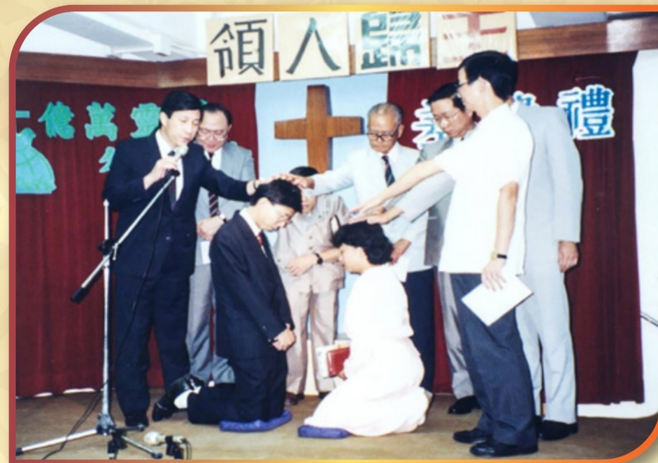
1991 年作者與太太被差往泰國宣教

首先，我們策略性地在曼谷植堂。起初，我們在一間名為 Ban Suan 的餐館參與開荒（後來發展成「曼谷家園教會」），然後租了一棟排屋的其中兩層。後來，我們教會更自置堂址，並著重門徒及領袖訓練。感謝