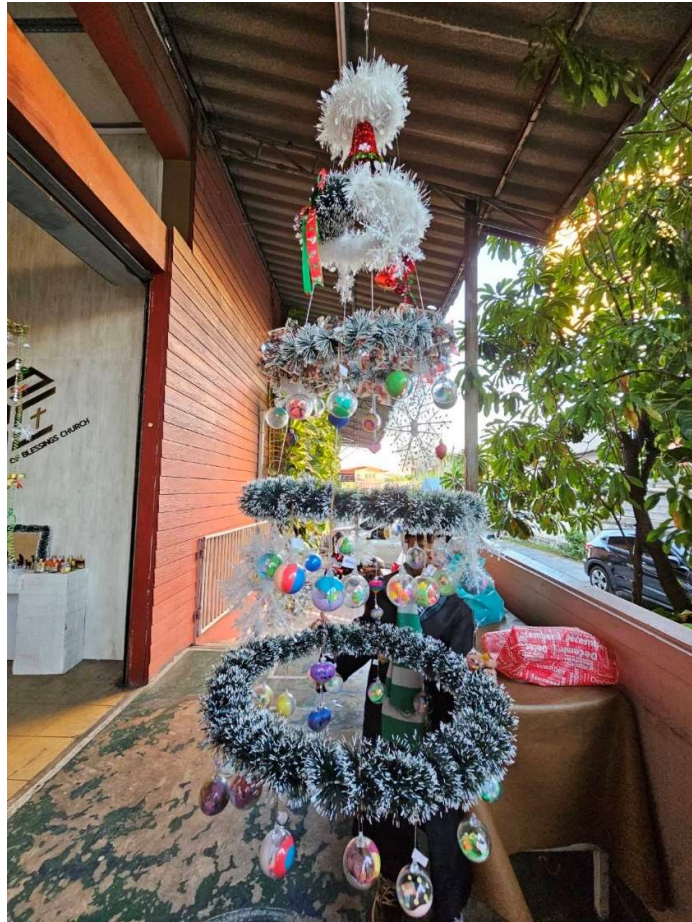
與其中一間合作教會透過聖誕藝術裝置展示社區孩子們的藝術創作