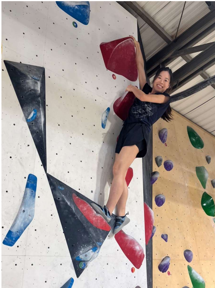
攝於曼谷一間室內抱石場