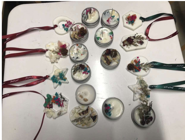
與另一間家庭教會合作舉辦香薰蠟片工作坊