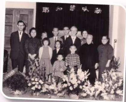
1962年，香港希伯崙堂獻堂禮