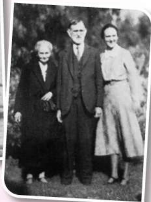
出席父母金婚紀念慶典