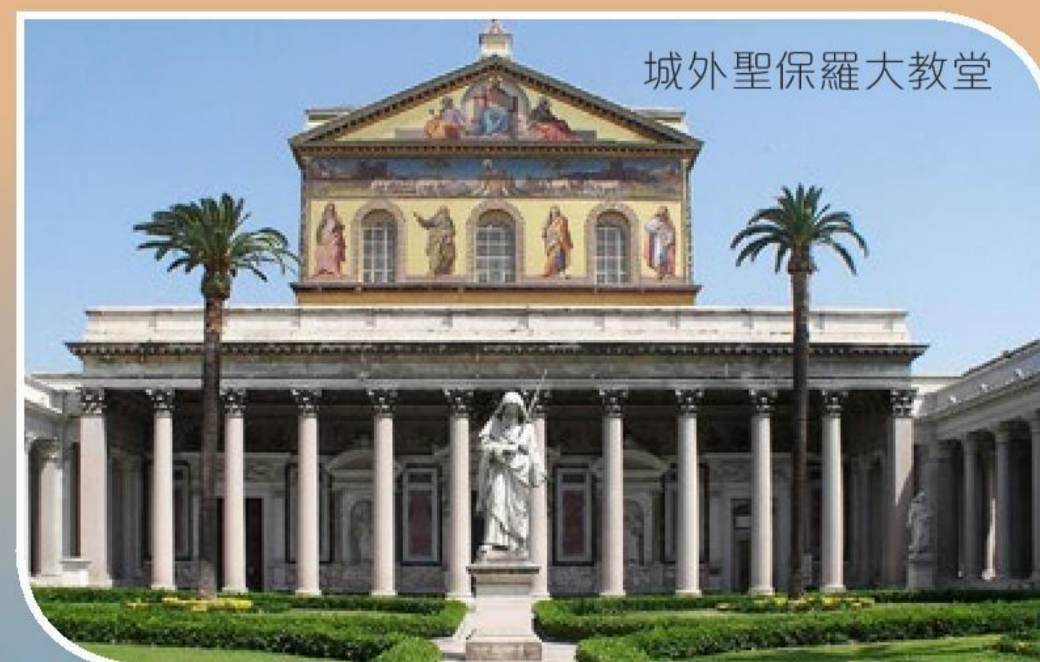
城外聖保羅大教堂

五世紀，蠻族攻陷了羅馬帝國西部，成立了多個新王國。在無統一政府狀態下，教宗成為了維繫西歐社會秩序的領袖。但身處亂世，教宗不得不轉向王國君主和貴族尋求生存空間，方法往往是以教宗的權威，協助新君主獲取民眾的認可（如為他們加冕），以換取軍事上的蔭庇。主後 800 年聖誕節，教宗里奧三世 (Leo III) 為怕羅馬貴族的進攻，當法蘭克王國君主查里曼 (Charlemagne) 在聖彼得大教