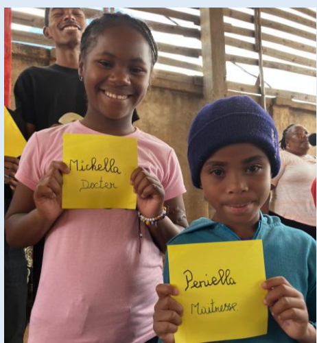
孩子們夢想成為醫生和老師