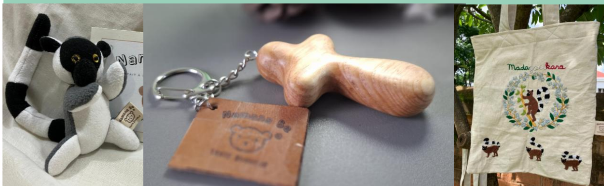
生命轉化計劃參與者研發各樣新產品

我們深願這些病人家庭能不住地透過職業培訓和神的話語，提升自我價值，有著尊嚴地活著，倚靠神過每一天；也盼望神興起更多弟兄姊妹，藉這計劃參與差傳，一同經歷我們的神，確實是一位顧念貧窮人的神。