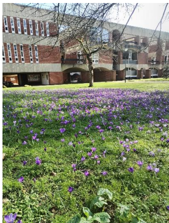
春天的使者藏紅花