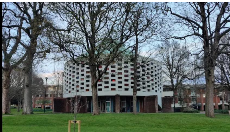
圓形建築的 Meeting House