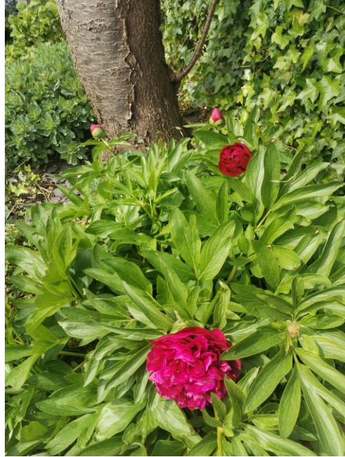
牡丹-神創造的美好