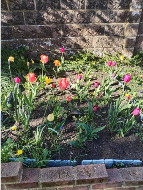
鬱金香-神美好的創造