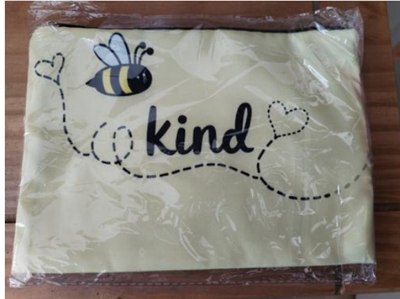
購物袋-母親節禮物