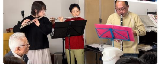
Christmas Eve 崇拜