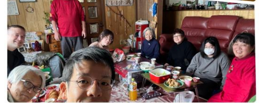
朝日家庭聚會+Joyful Ladies 聚會