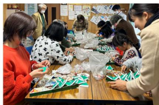
Advent Calendar 佈道活動