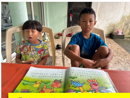
「苦爸」家教中文課的情況