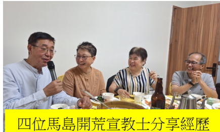
四位馬島開荒宣教士分享經歷