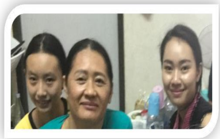
早前攝影 左：阿邁、中間：媽媽

探訪當天，我們唱詩、分享經文及詢問媽媽的信仰情況，她表達自己已確信耶穌，真的感謝神！之後我們為她能起來行走及得醫治禱告，要用泰文表達這樣