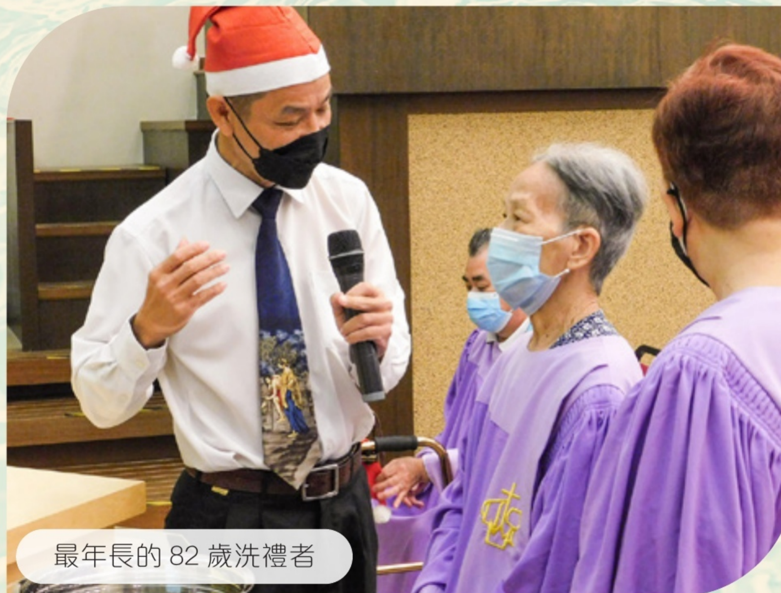
最年長的 82 歲洗禮者