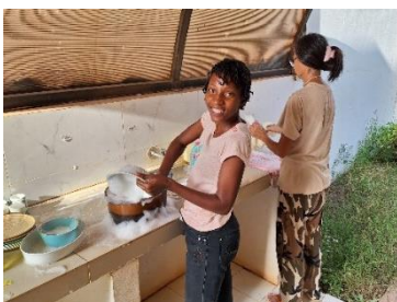
感恩有本地朋友來幫忙。

又如是者，我們兩日後再去檢查，大家都估到問題仍未完全解決。但這次我們決定留下大半天，等他們承諾當天可完成的事做好才走。結果我們終於可以有條件收樓，取了門匙，搬進去後再繼續維修。