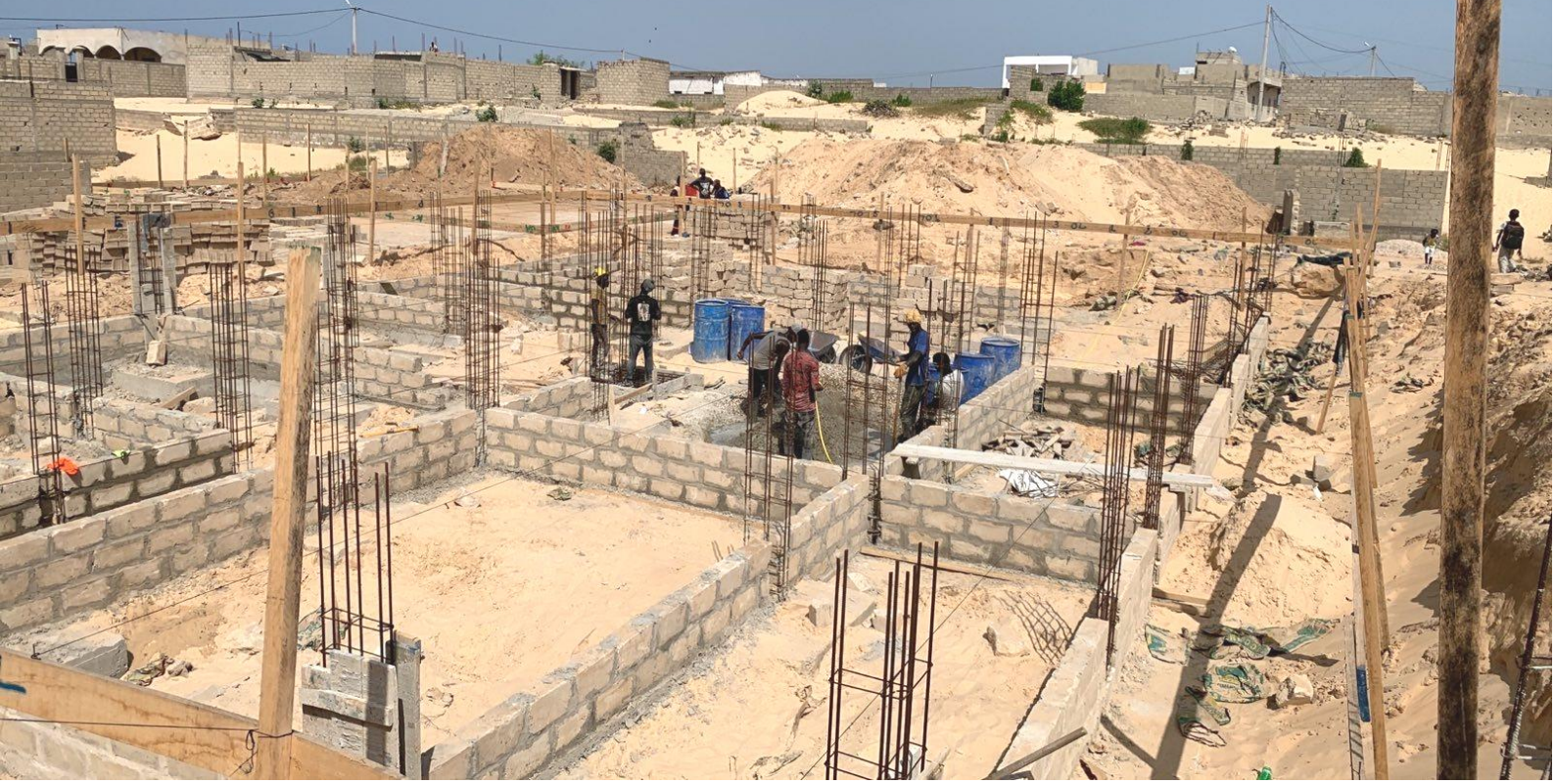
另一平房開始建地基