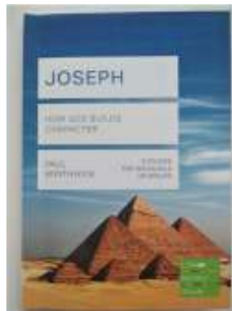
教會各查經組一起查考約瑟生平