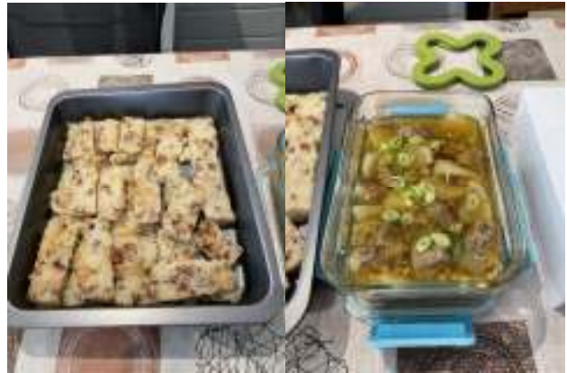
家聚中每個家庭都弄「拿手」美食