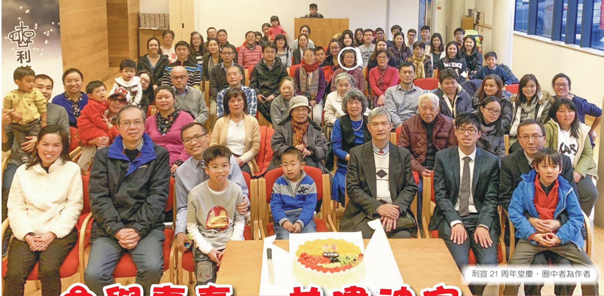
利宣 21 周年堂慶，圈中者為作者