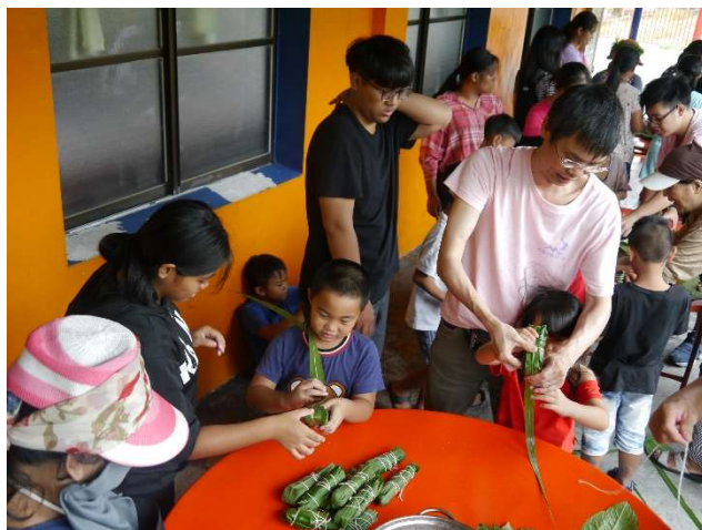
學做排灣族人的傳統食物

氹宣家今年去台灣短宣是教會推行宣教教育的第二年。過程中，大家經歷不同的文化衝激，並明白大家對工作內容的觀念和要求有不一樣的理解，所以，這些刺激我們去學習了解、消化和接納。感恩，我們完成得不是最完美，卻看到神使用我們這些並不優秀的隊友，使我們有機會去參與、去體驗！