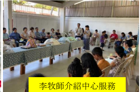
李牧師介紹中心服務