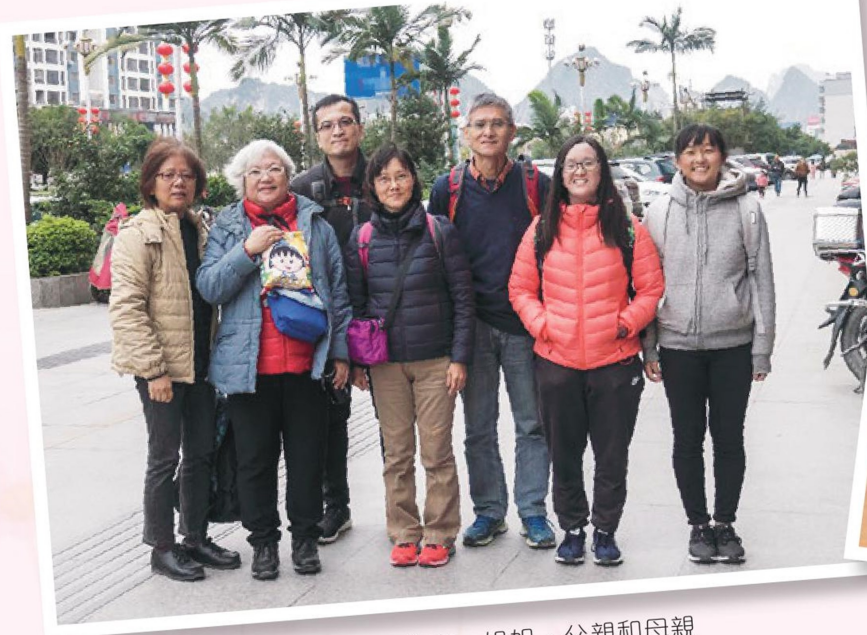
右1至右4：作者、姐姐、父親和母親