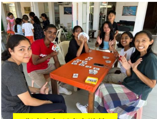
與青少年玩桌上遊戲