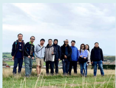
與英國華人宣道會聯會(「華宣」)合作

本會在英國有3間堂會(東倫敦、南倫敦及布萊頓)，事工主要為開荒、佈道、植堂、訓練、大學校園事工及本地跨文化宣教等。而本會亦與英國華人宣道會聯會(簡稱「華宣」)合作。