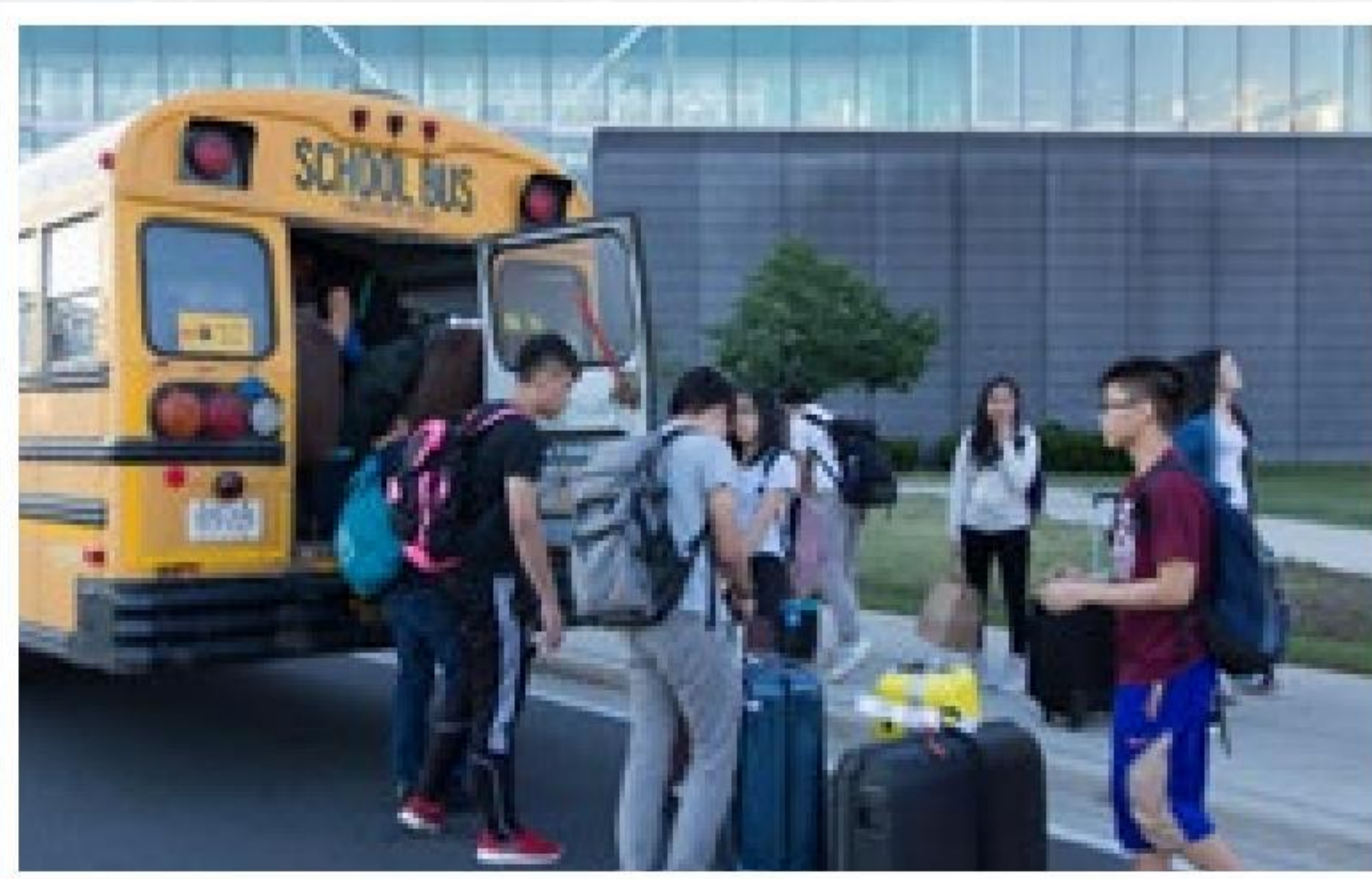
短宣隊在多倫多的交通工具——當地校巴