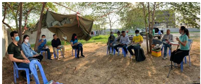
2 月底在工場新地皮舉行小組聚會

3 月轉為 Zoom 上崇拜及小組，最初我們擔心肢體抗拒，却發現一年後大家已習慣網上工作，首次 Zoom 上崇拜見面時亦感親切；喜見數張熟悉面孔，他們已數年沒返聚會，因疫情打斷平常生活重新參加。雖然網絡有時不穩定，又或遇到手提電話數據用盡、電池沒電，弟兄姊妹都珍惜一起敬拜、分享及代禱。